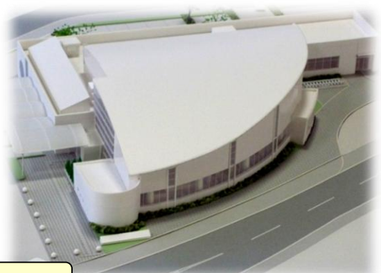
外部の完成イメージ